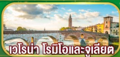
เวโรน่า โรมีโอและจูเลียต

• ชมเมืองเวนิสครแห่งสายน้ำ • เยือนเซอร์แมท ขึ้นรถไฟกรอนเนอร์เกรต • ชมเมืองเจนีวา ที่ตั้งองค์การสาครระดับโลก • ศาลาไทยที่โลซานน์ • เมืองมรดกโลกกรุงเบิร์น • ยอดเขาจุงเฟรา