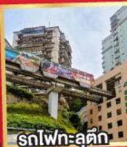
รถไฟฟ้า-ลู่ตีก