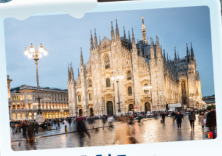
คูโอโม มิลาน