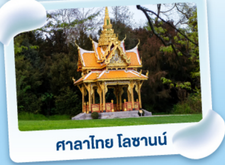
ศาลาไทย ไสซานน์