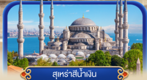
สุเหร่าสีน้ำเงิน