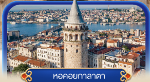
หอคอยกาลาตา