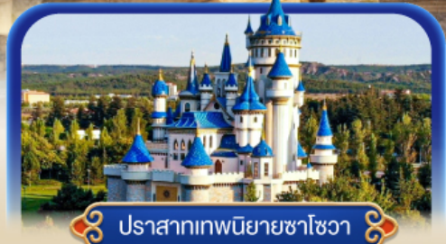
ปราสาทเทพนิยายซาโฮวา