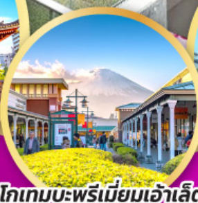
โทเกมะพรีเมียมเฮ้าส์