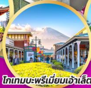
โทเกมบะ-พรีเมียมเฮ้าส์