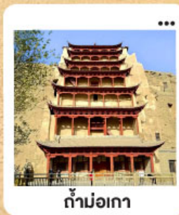
ถ้ำม่อเกา