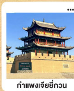
กำแพงเจียยี่กวน