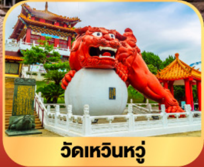
วัดเหวินหู