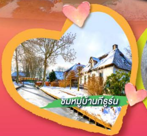
ชมหมู่บ้านกิธูร