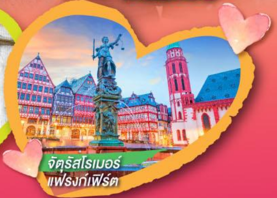
จัตุรัสโรเมอร์ แฟรงก์เฟิร์ต