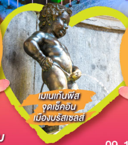
เมเนกันพิส จุดเช็คอิน เมืองบริสเซลส์