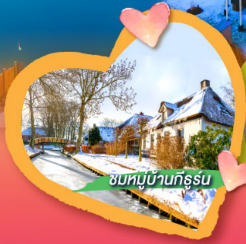
ชมหมู่บ้านกิธูร์น