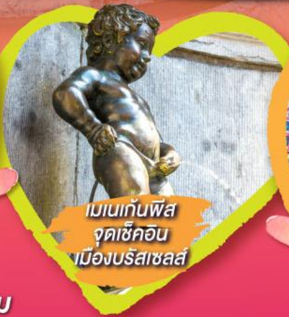
เมเนกันฟิส จุดเซ็คอิน เมืองบรัสเซลส์