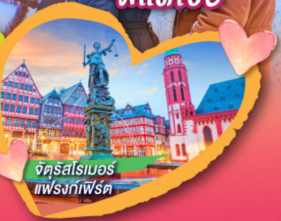
จัตุรัสโรเมอร์ แพรงก์เฟิร์ต