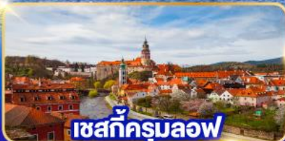
เซสท์ক্রุมลอฟ