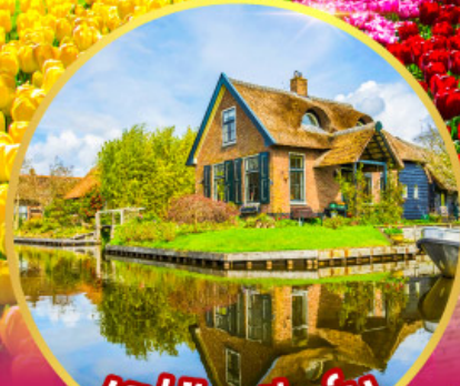
หมู่บ้านที่รูรัม