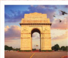
♡♡▽ India Gate