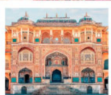
♡♡▽ Amber Fort