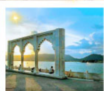
Ana Sagar Lake