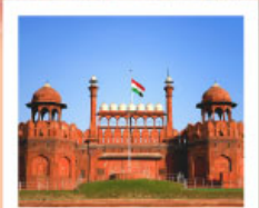
♡♡▽ Agra Fort