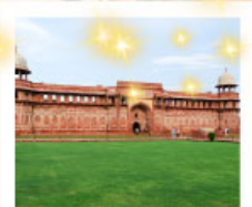
Ajmer Sharif Dargah