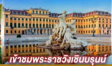
เข้าชมพระราชวังฮินบรุนน์