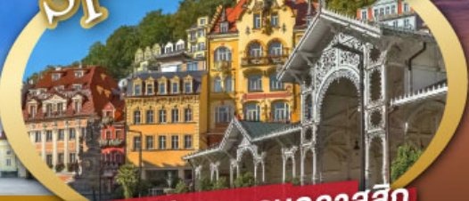
ชมสถาปัตยกรรมคลาสสิก เมือง คาร์โลวี วารี