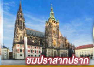
ชมปราสาทปราก