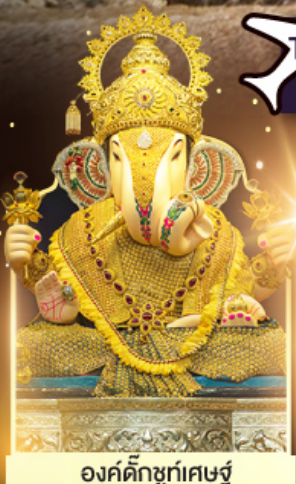
องค์ดีกษุทีพิเศษผู้