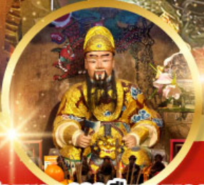
วัดแซกง 600 ปีหยุนหลอง