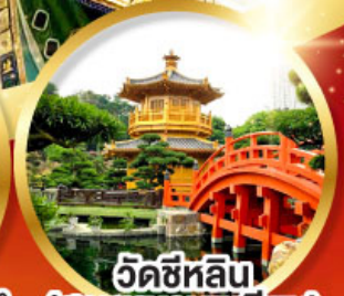
วัดชหลิน