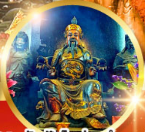
วัดปักโต้อ่องอำ