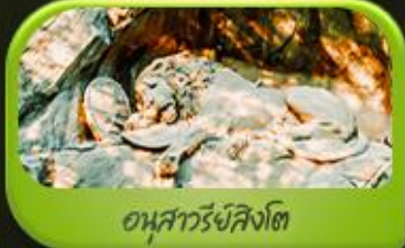
อนุสาวรีย์สิงโต