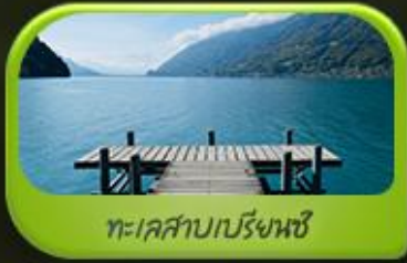
ทะเลสาบเบรินซ์