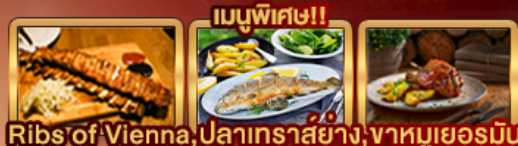
เมนูพิเศษ!! Ribs of Vienna, ปลาเทราสย่าง, จาหมูเยอรมัน