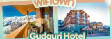
Gudauri Hotel วิวเทือกเขาคอเคซัส