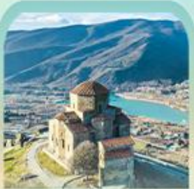
มตซิทาเรจวารี