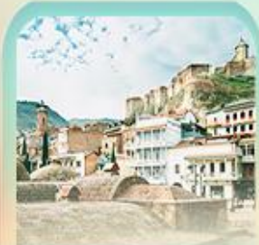
อะบาโนตูปานี