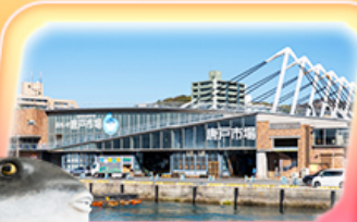
ตลาดปลาคาราโตะ

เดินเล่นหมู่บ้านยูฟูอินสุดน่ารัก ชมวิวทะเลสาบคินริน ย้อนอดีตกับ โมจิโกะ ไรโท นั่งเรือเฟอร์รี่ เช็คอินตลาดปลาอาราโตะ ถ่ายภาพปราสาทโคคุระ ช้อปบิงจูโจที่ เอาเก้เล็คคิตะคิวยู