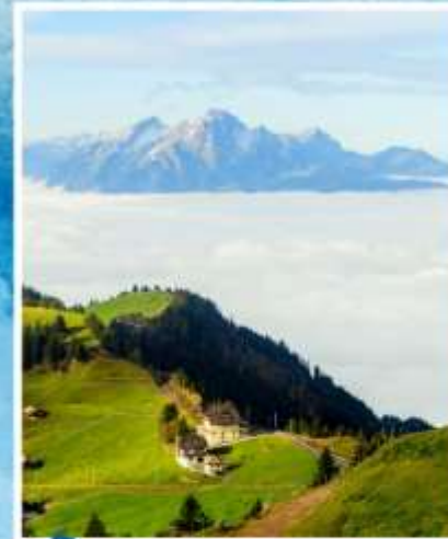
RIGI KULM Queen of the Mountains