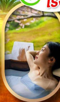
แช่บ่อออนเซ็นญี่ปุ่น