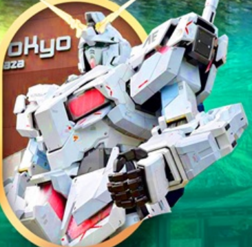
ห้างไอโดะบะกันดั้ม