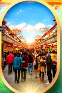
ถนนนากามิสะ