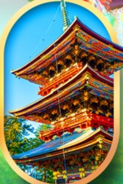
วัดนาริตะะซัง