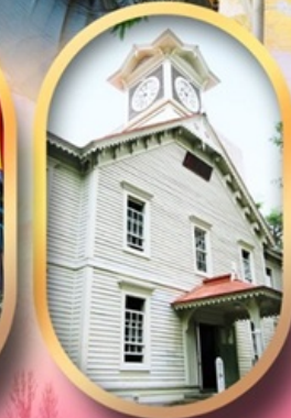
ผ่านชมหอนาฬิกา