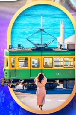
ถนนโคมาจิโคริ