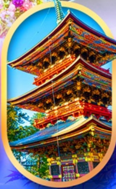
วัดนาริตะซัน