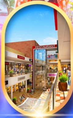
มิตซูเอ้าท์เล็ต