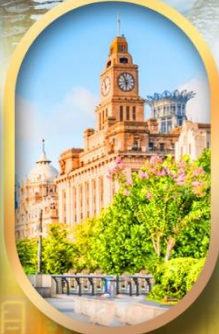
เดอะบีนด์