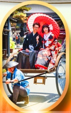
เมืองเก่าทาคายามา