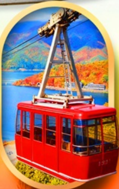
ขึ้นกระเช้าทะเลสาบมิกะตะ