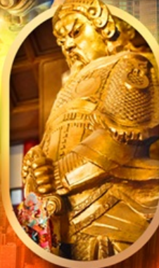
ทองพระวัดเซ่ง

เที่ยว 2 ประเทศ ทองพระ วัดตั้ง ช้อปปิ้งจุใจ