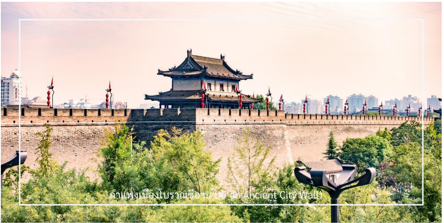
กำแพงเมืองโบราณซีอาน (Xi'an Ancient City Wall)

จากนั้นนำท่าน ผ่านชมจัตุรัสหอกลองและหระฆังซีอาน (Xi'an Drum & Bell Tower) แลนด์มาร์คสำคัญที่ตั้งอยู่ใจกลางเมืองซีอาน และถือเป็นสัญลักษณ์ทางประวัติศาสตร์ของเมืองหระฆังและหอกลองสร้างขึ้นในสมัยโบราณ เพื่อใช้บอกเวลาและส่งสัญญาณเตือนภัยให้กับผู้คนภายในเมือง โดยในอดีตจะตีระฆังในช่วงเช้า และตีกลองในช่วงค่ำ จนได้รับการขนานนามว่าเป็น “ระฆังรุ่งอรุณ กลองยามค่ำ” ปัจจุบันสถานที่แห่งนี้ยังคงได้รับการอนุรักษ์ไว้อย่างดี และเป็นอีกหนึ่งจุดสำคัญที่นักท่องเที่ยวนิยมมาเก็บภาพบรรยากาศใจกลางเมืองซีอาน