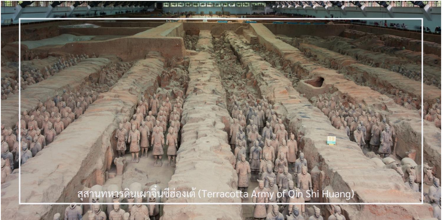
สุสานทหารดินเผาจีนซีฮ่องเต้ (Terracotta Army of Qin Shi Huang)

หลังอาหารนำท่านเดินทางสู่ สุสานทหารดินเผาจีนซีฮ่องเต้ (Terracotta Army of Qin Shi Huang) ใช้เวลาในการเดินทางประมาณ 1 ชั่วโมง ที่นี่คือหนึ่งในสิ่งมหัศจรรย์ของโลกยุคโบราณและแหล่งโบราณคดีที่สำคัญที่สุดของจีน ตั้งอยู่ใกล้เมืองซีอาน มณฑลส่านซี ค้นพบโดยบังเอิญในปี ค.ศ. 1974 ก่อนจะได้รับการขึ้นทะเบียนเป็นมรดกโลกโดยยูเนสโกในปี ค.ศ. 1987 ภายในเป็นสุสานของ “จีนซีฮ่องเต้” จักรพรรดิองค์แรกของจีนผู้รวบรวมแผ่นดินเป็นหนึ่งเดียวในยุคราชวงศ์ฉิน ครอบคลุมพื้นที่หลายหมื่นตารางเมตร แบ่งเป็น 3 หลุม ซึ่งภายในมีทหารดินเผากว่า 8,000 ตัว ที่ถูกสร้างขึ้นอย่างประณีต มีใบหน้า ท่าทาง และเครื่องแต่งกายแตกต่างกันไป พร้อมด้วยรถศึก ม้า และอาวุธโบราณ ที่วางเรียงรายอย่างเป็นระเบียบในหลุมฝังศพ เพื่อปกป้องจักรพรรดิในชีวิตรหลังความตาย