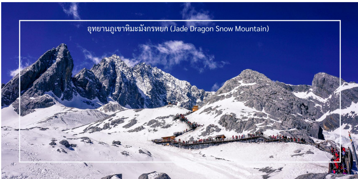
อุทยานภูเขาหิมะมังกรหยก (Jade Dragon Snow Mountain)

การท่องเที่ยวบริเวณภูเขาหิมะมังกรหยกนั้น ถือเป็นจุดที่มีออกซิเจน ที่เบาบางมาก รวมไปถึงระดับความสูง ที่มีอากาศหนาวเย็นและลมแรง ควรเตรียมร่างกายของท่านให้พร้อม และปฏิบัติตามคำแนะนำของไกด์ท้องถิ่น และหัวหน้าทัวร์อย่างเคร่งครัด และควรมีกระป๋องออกซิเจนแบบพกพา เพื่อช่วยเหลือนักเดินทาง ในกรณีที่ท่านมีอาการแพ้ความสูงแบบเฉียบพลัน (หมายเหตุ: กรณีที่มีการประกาศปิดให้บริการกระเช้าไฟฟ้า อันเนื่องมาจากเหตุผลด้านสภาพอากาศไม่เอื้ออำนวย, การปิดซ่อมบำรุง, หรือเหตุผลใดๆ บริษัทผู้จัดขอสงวนสิทธิ์ในการปรับเปลี่ยนโปรแกรมท่องเที่ยวอื่นทดแทน หรือในกรณีที่กระเช้าใหญ่ปิด ทางบริษัทผู้จัด จะเปลี่ยนมาขึ้นกระเช้าเล็กยูนชันผิงแทน โดยไม่ต้องแจ้งให้ทราบล่วงหน้า)