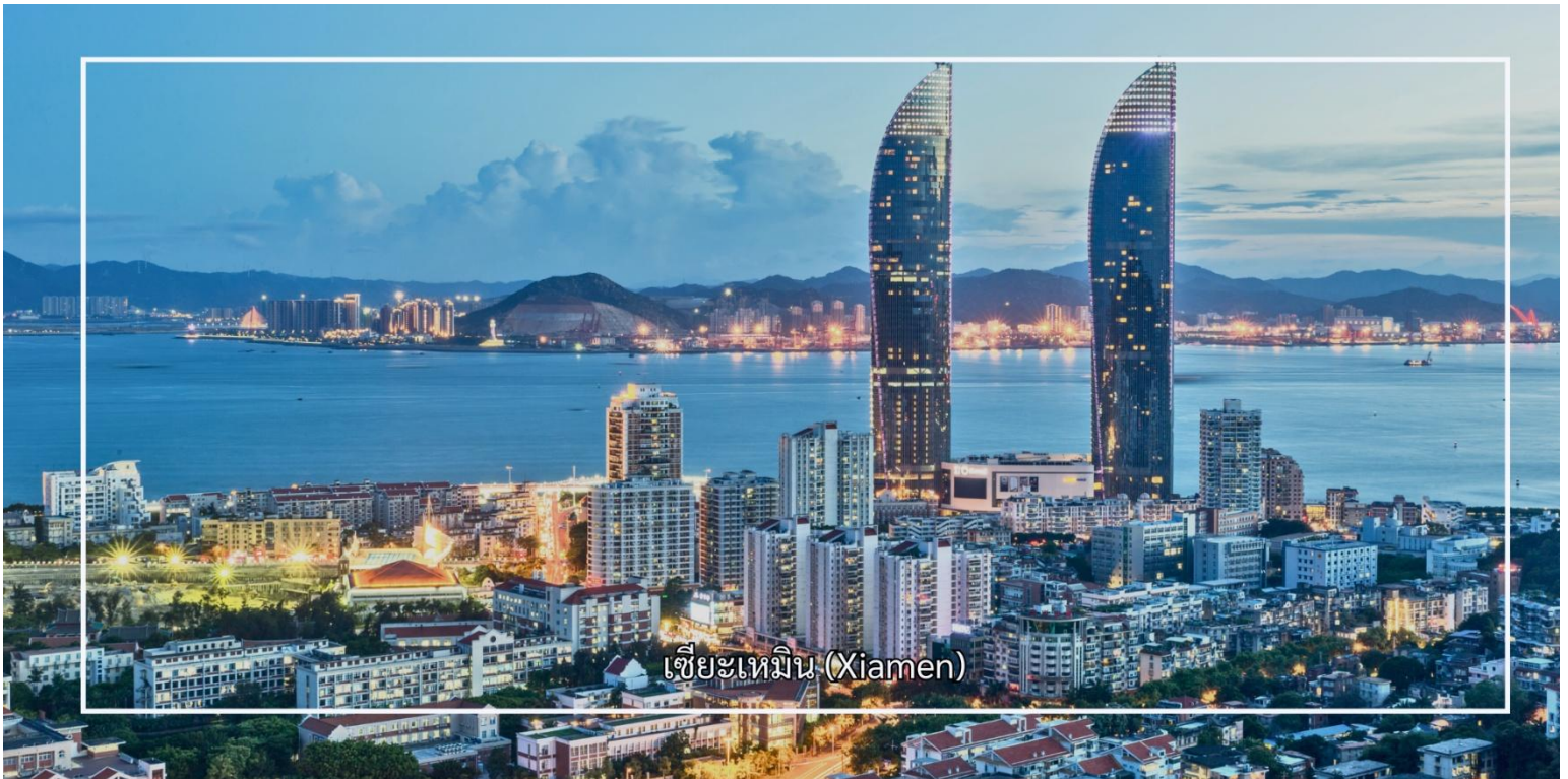
เซี่ยเหมิน (Xiamen)

นำท่านสู่ กลุ่มอาคารโบราณหมู่บ้านจีเหมย แหล่งท่องเที่ยวทางวัฒนธรรมที่สำคัญและสะท้อนเอกลักษณ์ทาง สถาปัตยกรรมของชาวจีนโพ้นทะเลอย่างโดดเด่น อาคารส่วนใหญ่สร้างขึ้นในช่วงต้นศตวรรษที่ 20 โดยเงินเจียเกิง