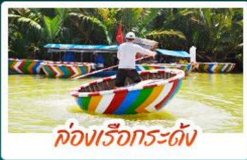
ล่องเรือกระทง