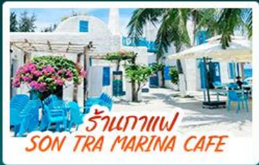
ร้านกาแฟ SON TRA MARINA CAFE