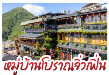
เมบูบ้านปิศาจจิ้งจิก