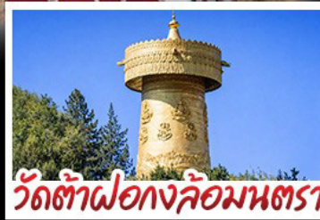
วัดต้าฝอ กงล้อมนตรา