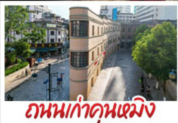
ถนนเก่าคุณหมิง