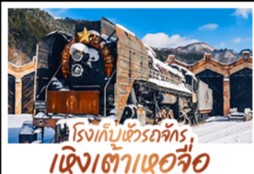
โรงเก็บข้าวรถจักร เชิงเต้าเอ่อจื่อ