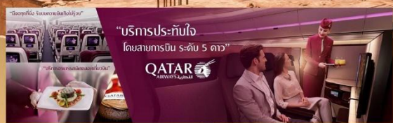
"บริการประทับใจ โดยสายการบิน ระดับ 5 ดาว"