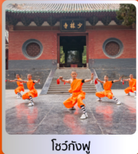
โซว์กิงฟู

อาหารมื้อพิเศษ บุฟเฟ่ต์ สุกี่หม้อไฟ เปิดปักษ์ซีอาน