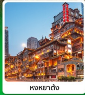
หงหยาด้ง

โกล่า! บิ้นตรงลงเินซือ เที่ยวสองเมืองเินซือ จ้งซ้ง หุบเขาสิงโต อุทยานหลุมบ่อฟ้า นั่งรถไฟความเร็วสูง