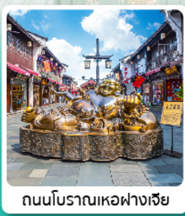
ถนนโบราณเหอฟางเจีย