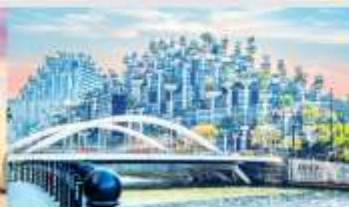
อาคารฟันทันไม