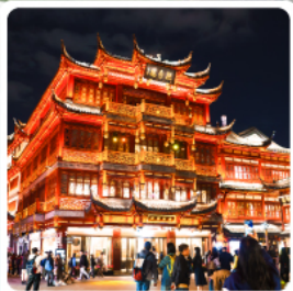
ตลาดร้อยปีเงินหวงเหมี่ยว