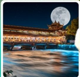
ส-พำนพนำนเจียว