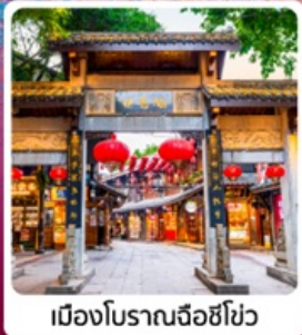
เมืองโบราณฉือซีโซ่ว