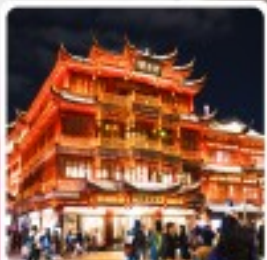
ตลาดร้อยปีเจินหวงเหมียว