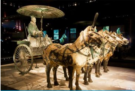
สุสานกองทัพทหารม้าจีน