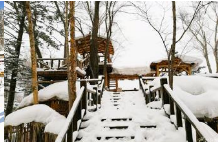
ระเบียงชมวิวปีงจูลุชาน

วันที่สาม เมืองฮาร์บิน-สถานีรถไฟยาลู-รวมนั่งม้าลากเลื่อน- หมู่บ้านหิมะ Xue xiang China Snow Town - ระเบียงชมวิว เขาปีงจูลุชาน- ชมแสงสียามราตรีหมู่บ้านหิมะ-ชมพลุไฟและขบวนพาเหรดระบำพื้นเมือง-นอนในหมู่บ้านหิมะ Xue xiang