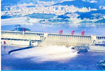
เขื่อนเก้อโจวป้า