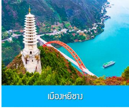
เมืองหยีซาง