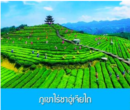
ภูเขาไร่ชาอู่เจียไค