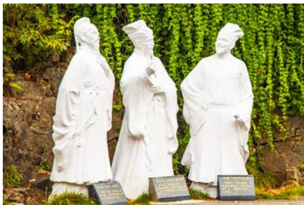
อุทยานถ้ำสามสหาย

สิ้นสุดโปรแกรมล่องเรือ นำคณะขึ้นฝั่ง ณ ท่าเรือหวงไป๋เหอ