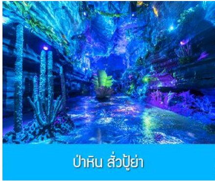
ป่าหิน สั่วปู้ย่า

ค่ำ รับประทานอาหารค่ำ ณ ภัตตาคาร (11) พักที่ โรงแรม ENHSI JINMA HOTEL ระดับ 4 ดาวท้องถิ่นหรือเทียบเท่าในเมืองเินซือ