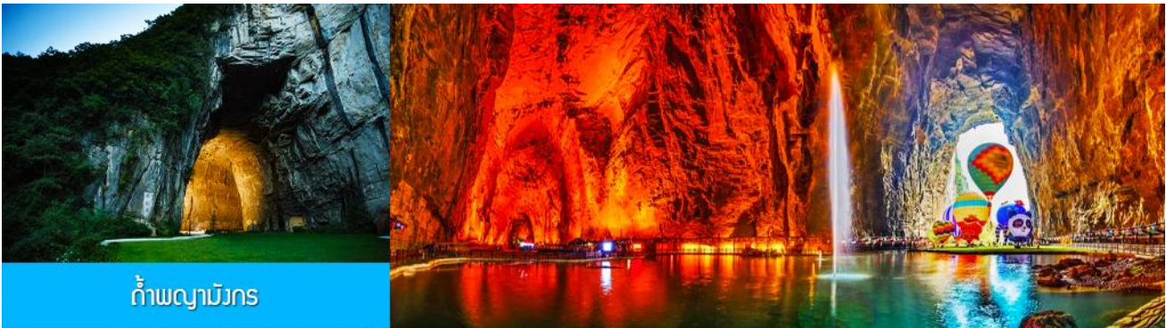
ถ้ำพญามังกร

พักที่ ENHSI JINMA HOTEL โรงแรมระดับ 4 ดาวหรือเทียบเท่าในเมืองเินซือ