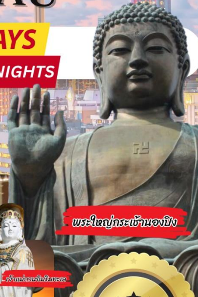
พระใหญ่กระซ้านงปิง