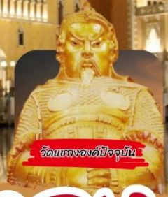
วัดแบกองค์ปัจจุบัน