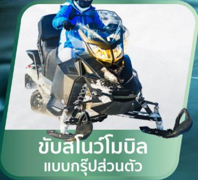
ขับสโนว์โมบิล แบบกรุปส่วนตัว