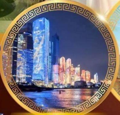
No.3 Bathing Beach

ลานจัดงานเบียร์ชิงเต่า Golden Beach ทางเดินไม้ริมทะเล ศาลเจ้าเทพทะเล ถนนคนเดินโตตง พิพิธภัณฑ์เทศบาลชิงเต่า สวนสาธารณะซิกแนลฮิลล์ ถนนหลงเจียงสู่ กระเช้าภูเขาไต้ผิง ยาน Da Bao Island โบสถ์ st.Michael's Cathedral ถนนจงชาน ถนนคนเดินฟิลาญย่วน จัตุรัสเบย์ไพล์