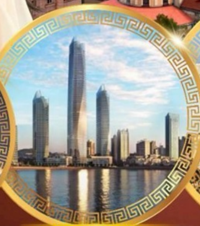
ชมวิวดาคารไฮตัน เซ็นเตอร์