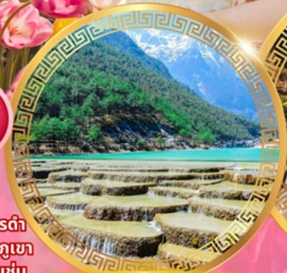
ทะเลสาบไป๋สยเหอ

เมืองโบราณคู่เสียง เมืองโบราณต้าหลี่ เจดีย์สามองค์ เมืองโบราณแชงกรี่ล่า วัดชงจ้านหลิน ช่องแคบเสือกะโจน สระมังกรดำ เมืองโบราณลี่เจียง ภูเขาหิมะมังกรหยก ชมวิวภูเขา หิมะที่ร้าน Yun di ta ชมดอกไม้ที่สวนอุทยานชุ่ม น้ำโกวหนาน ชมดอกซากุระสวนหยวนทง