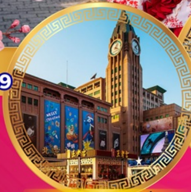
ถนนคนเดินหวังฝูจิ่ง

เที่ยวย่านการค้าดังกลางกรุงปักกิ่ง ถนนคนเดินหวังฝูจิ่ง จัตุรัสเทียนอันเหมิน พระราชวังกู้กง หอฟ้าเทียนถาน ช้อปปิ้งย่านซานหลี่ถุน พระราชวังฤดูร้อนอวิ๋เหอหยวน กำแพงเมืองจีนด่านอวิ๋หยงกวน ชมซากุระบาน สักการะวัดลามะ